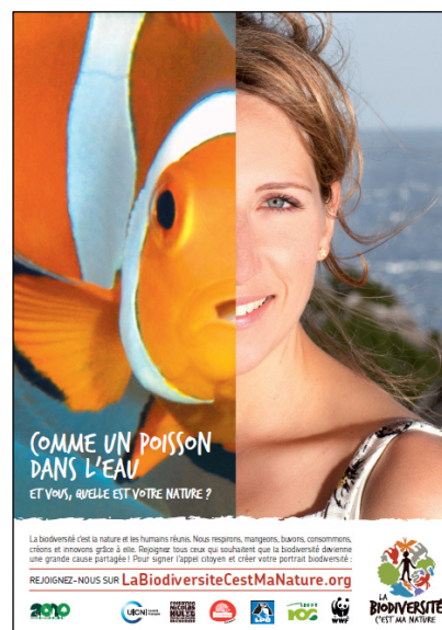
A fish out of water Maud Fontenoy (sailor)