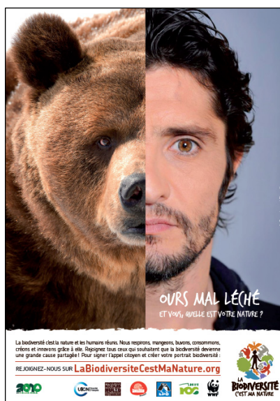
A bear with a sore head Bixente Lizarazu (football player, sports commentator)