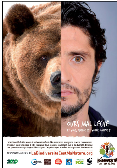
Oso hosco y gruñón Bixente Lizarazu (futbolista, comentarista deportivo)