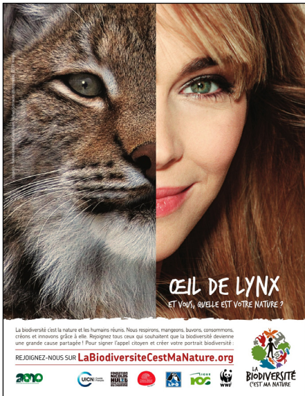
Ojo de lince Claire Keim (actriz)