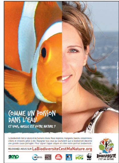
Maud Fontenoy (navegadora) Como pez en el agua