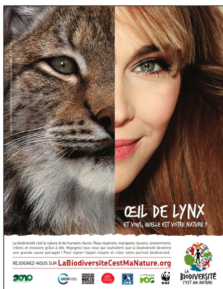
Sharp-eyed as a Claire Keim (actress)